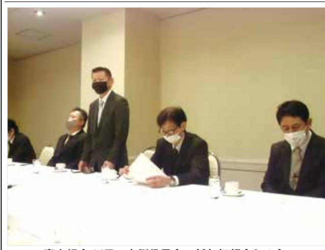
富山組合 14日 定例役員会、新年初顔合わせ会