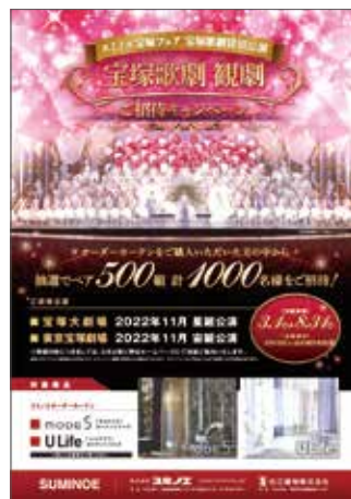
キャンペーンチラシ