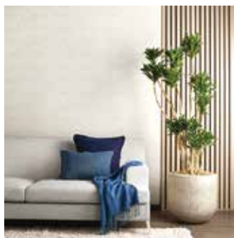
「クラフトライン」の新デザイン

「クラフトライン」は、3年ぶりに改定された。新しい点。クラフトラインは、工芸のような風合