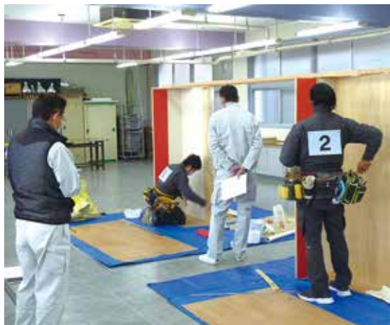
愛媛組合 15日 外国人派遣労働者の技能検定

※新型コロナウイルス の爆発 的流行により、1月に 計画していた勉強会等組 合行事は中止。