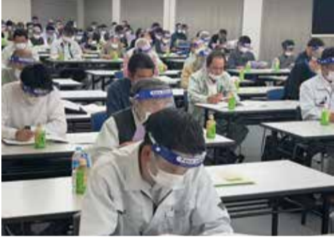
防災業務・防火壁装講習会

この中で第一の関門となったのが総代数の決定だ。総代は組合員数10名につき1名以上