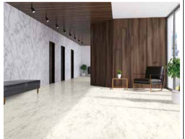
新型コロナウイルスも低減する「CT シリーズ」

ロンシール工業は、抗ウイルス性床材「CTシリーズ」、「CTシリーズSコレクション」のラインナップ拡充、および発泡層付き抗ウイルス性ビニル床材「ウェルリウムCT」を新発売した。