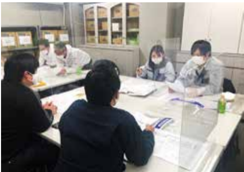
職長・安全衛生責任者教育

た。結果的に、組合員数539名(12月6日現在)のうち394名(出席16名・リモート出席4名・書面出席374名)が臨時総会に出席した。そして審議の結果、賛成多数(賛成391名・反対3名)で可決承認されるに至った。 こうして正式に「総代会」設置が決定したことを受けて、総代選出選挙管理委員会を設置し、4度にわたる選挙管理委員会を経て3月14日に各地区の総代60名が決定した。 以上のような経緯をもって「総代会」設置の準備が完全に整い、来る6月17日(金)、第1回総代会を名古屋マリオットアソシアホテルにて開催する運びとなったのだ。