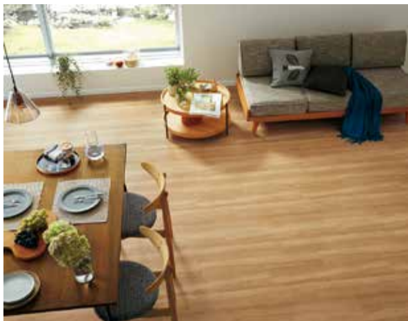
リアルな木目を表現

シンコールインテリアは、「みんなにフィットする」をコンセプトにした、住宅用クッションフロア「Ponleum (ポムリウム) 2022-2024」を、このほど発売した。