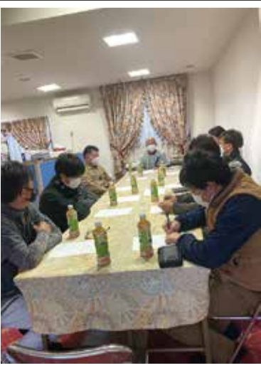
長野組合 18日 次世代委員会