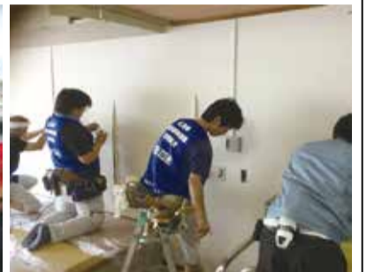
特別支援学校へのボランティア