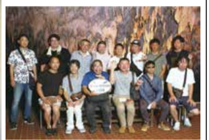
沖縄への研修旅行