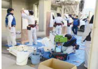
工業高校での体験授業