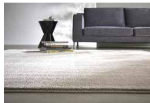
「BIG SIZE RUG」イメージ