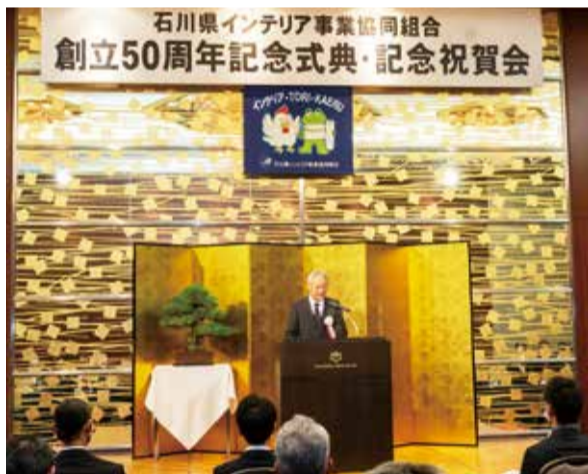
50周年記念式典の様相

周年記念式典・記念祝賀会」を執り行った。谷本正憲石川県知事をはじめとする来賓や組合員、賛助会員など計75名が出席