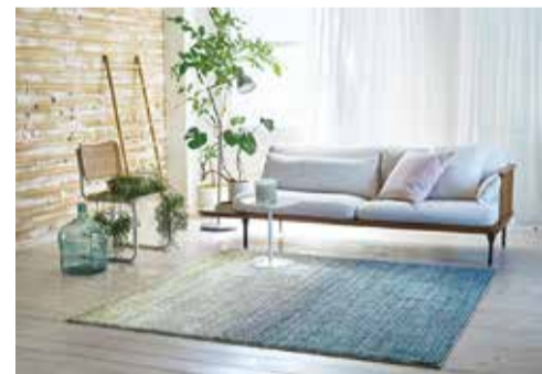
「HOME RUG MAT」イメージ

スミノエは、ホームユースカーペット総合見本帳「BIG SIZE RUG VOL.9」、および「HOME RUG MAT CATALOG 2020・2021」を新発売した。新「BIG SIZE RUG」では、シリーズのコンセプトであるテク