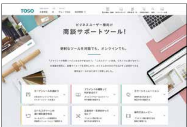
「商談サポートツール」ホームページ画面

トソーは、販売者がエンドユーザーと窓まわり製品の打ち合わせをする際に便利なウェブコンテンツとして「商談サポートツール」を、このほどホームページ上に公開した。「商談サポートツール」は、窓まわり製品の種類紹介や、カラーシミュレーション、ロールスクリーン透過感が確認できるシミュレーター、操作方法ムービーなど便利な6コンテンツを展開、たくさんのカタログをばいずワンストップで説明ができるようになっている。商談時間の効率化を図れる。