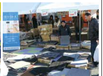
「卸街まつり」に出店