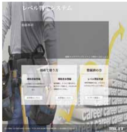
「レベル判定システム」 https://noryoku-hyoka.keg.jp/evel_1.0.0/portal

決まり、それによって賃金アップ等に反映されれば、「働きがい」につながるというわけだ。 さて、その利用手順であるが、まずはシステムへの登録が必要となる。登録には「事業者登録」と「技能者登録」の2種類が必要(一人親方も両方の登録が必要)となるが、最初に「事業者登録」を行い、次に「技能者登録」を行う(現在、登録方法はインターネットのみとなっている)。 建設キャリアアップシステムのメインはやはり「技能者登録」で、ここ自身の能力に合致したレベルとするためには、カード発行後に能力評価基準を申請する必要がある。申請は申請者本人が行う(500円)。