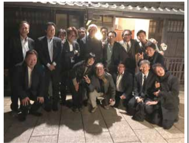
京都への研修旅行

「若久緑園」の内装施工以外も行っており、関山前理事長(日装連副理事長)の紹介で福岡市内の福祉型障がい児入所施設