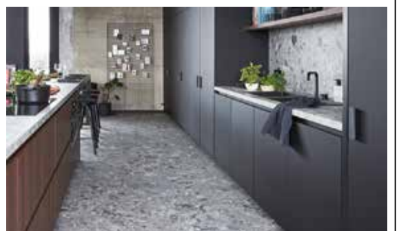
PURE 石目調 TILES

「LVT」は、3DPプリント技術によるリアルな質感、0.55ミリ厚のウレタン耐摩耗層による極めて高い耐久性を持つ高機能床材で、近年欧米で飛躍的に市場が拡大している新硬質床材である。同社でも2017年9月に発売し注目を集めた。今回、新色が追加されるのは、木目調の「PURE 木目調 PLANKS」で、近年欧米で飛躍的に市場が拡大している新硬質床材である。同社でも2017年9月に発売し注目を集めた。今回、新色が追加されるのは、木目調の「PURE 木目調 PLANKS」に追加、計6柄35アイテムとなる。また石目調の「PURE 石目調 TILES」には4柄13アイテムを追加した。