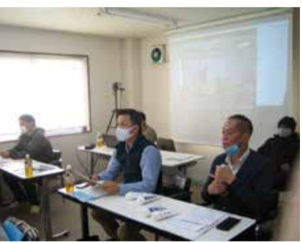
ビデオで撮影しzoomで配信

ポンド工業に講師を依頼し、『下地基材への下地調整剤の塗布やパテ処理から、壁紙が仕上がる』までの工程確認から副資材の特性、使用目的などを分かりやすく解説するもの。若年者向けということで、パテの目的や「なぜやるのか」、接着剤の仕組み、接着剤の使い方など施工に不可欠な