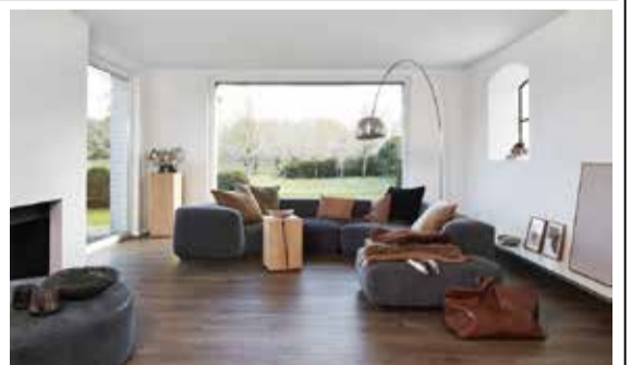
PURE 木目調 PLANKS

スミノエは、高機能塩ビ硬質床材「LVT」（ラジューアリービニルタイプ）の「PURE CLICK55」タイプに新色を追加した。