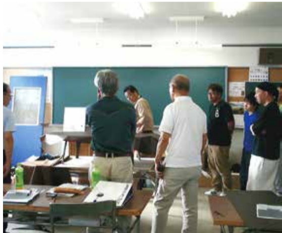
化粧フィルム講習会 (技能講習)

「組合の存続を考えれば、改革は避けられない状況になっていました。愛知組合のラベル改革を参考に、当組