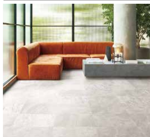
マティール クアトロシリーズ

田島ルーフィングは、複層ビニル床タイル「ウッドライン」「マティール」において新色96色を追加するなどリニューアル発売した「ウッドライン」と「マティール」は高い意匠性と豊富な色数が特徴のシリーズ。今回の色改訂では、木目柄メインの「ウッドライン」に新色31色、石目・抽象柄メインの「マティール」は新色65色を追加した。4種の砂岩柄で上質な空間を作り上げるクアトロシリーズ、アイテム増となる大判サイズ、細かなフロアデザインを疑似的に再現できる簡易施工シリーズなど、特徴的な新色を多数ラインナップしている。