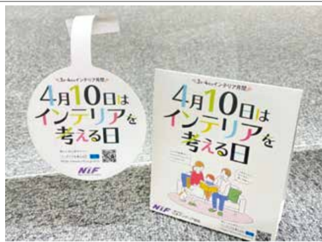
参加店用販促ツール