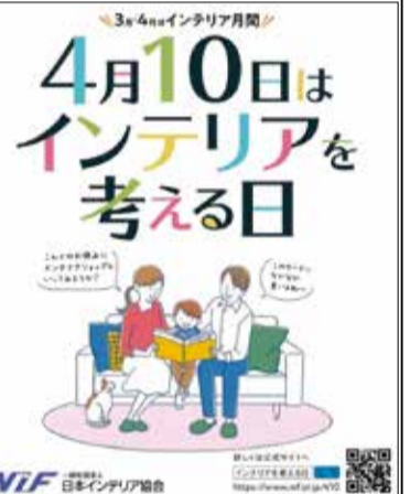
キャンペーンビジュアル

当時の求人引手あまたで、大手電機メーカー・電力会社などの大企業の社名が学務課の掲示板に張り巡らされておりました。クラスの内三分の一が進学、他は大手企業に内定しました。