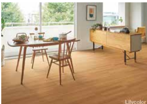
LH 81303 「ファインオーク」