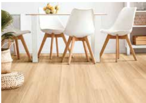
LH 81311 「ヒッコリー」

リリカラは、全点抗菌・防カビ・耐次亜塩素酸仕様の床材見本帳「クッションフロア」2022(2025)を新発売した。