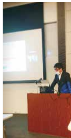
JAC館部長による説明

2019年4月に創設された特定技能外国人制度における建設分野の在留外国人が、2021年3月末時点で、飲食料品製造業分野の8104名、農業分野の3359名に続き、2116名と増加している。 そこで、一般社団法人建設特定技能人材機構（JAC）では、特定技能外国人制度を正しく理解し活用してもらうため、7月から8月にかけて、建設分野における特定技能外国人制度の説明会を九州・沖縄地区にて行った。説明会は、オンラインで全国どこからでもWEB上に視聴できるライブ配信方式で、全国各地から建築建設企業が同時に参加した。