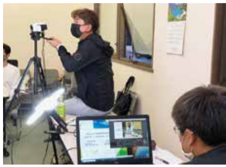
本格的な撮影風景