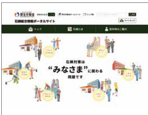
「石綿総合情報ポータルサイト」トップ画面 https://www.ishiwata.mhlw.go.jp

環境省では、令和2年6月5日に、建築物等の解体・改修・リフォームなどの工事における石綿(アスベスト)の飛散を防止するため、「大気汚染防止法」の一部を改正する法律を公布、今年4月1日より順次施行されている。