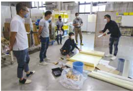
滋賀組合 25日 壁装作業の技能講習会