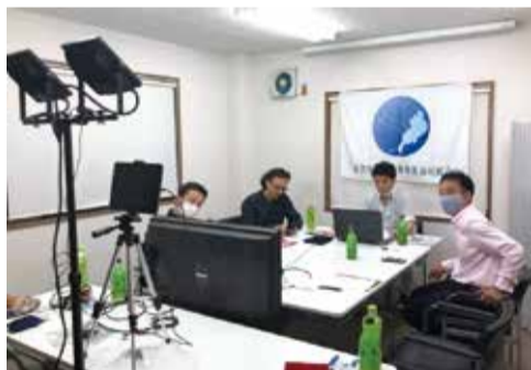
リモート講習会「資金繰り講座」