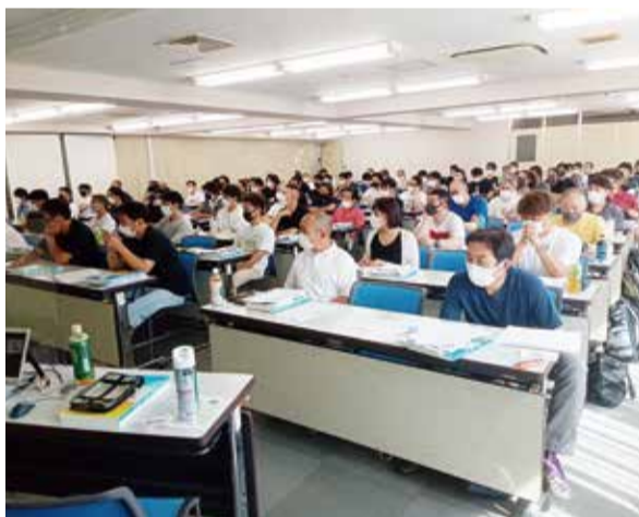
東京会場での講習

日装連、全室協、ジェー基本技能者推進協議会(8月4日〜6日・日本教育会館)を開催した。