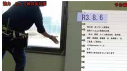
ガラスフィルム実演映像（告知用動画）