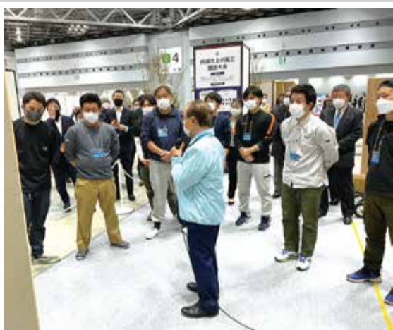
競技前の説明会の様子

同競技大会は、若手技能者(23歳以下)の日本ナンバーワン技能者を定める「技能五輪」の種目に内装仕上げ技能(壁紙を貼る)を目的に、日装連、日技連、全表連の3団体が共同で企画したもので、今年「第59回技能五輪」が東京都主催にて12月17日(金)〜20日(月)に東京ビッグサイトで行われることを受け、絶好のPRチャンスと捉えて、技能五輪全国大会に準じたデモンストラーション競技大会という形式で行われた。