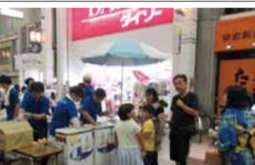
『土曜夜市』への出店

もう一つの継続事業は「土曜夜市」への出張授業だ。これは毎年7月に行われる高知市を代表する一大イベントで、市内の商店街に多数のお店が並び、子供から大人まで大勢の人が集まってくる。ここに高知組合として出店しカーテンやカーペットのハギレを格安で販売するという。