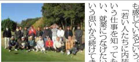
ゴルフコンペも企画

「若い人たちに内装という仕事を知ってもらい、就業につなげたいという思いから続けてきました。コロナ禍のため去年今年と参加しなかったが、