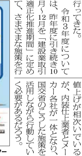
「建設業取引適正化推進期間」ポスター