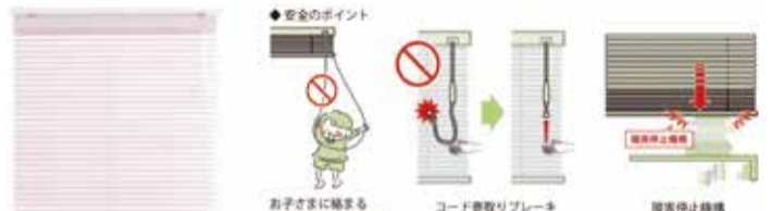
ニチベイ 「スマートタッチグランツ 25・35」

トソーの「クリエイティーループレス」は、ループ状の操作チェーンやコードがないのが特徴で、小さな子どもが遊んでいる最中に体に巻きつく心配がない。 またニチベイの「スマートタッチグランツ25・35」も操作コードがループ状になっていないのが