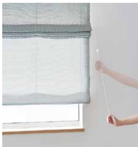
トソー 「クリエイティーループレス」

トソーのローマンシェード「クリエイティーループレス」、およびニチベイのよこ型ブラインド「スマートタッチグランツ25・35」が「第15回キッズデザイン賞」(主催、キッズデザイン協議会)を受賞した。 「子どもたちが安全に暮らす」「子どもを産み育てやすい社会をつくる」という目的を満たす製品・サービス・空間・活動・研究などから優れた作品を選び、社会に発信していくことを目的に2007年に創設されたデザイン賞である。