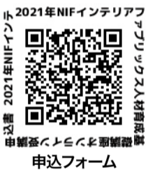
2021年NIFインテリアファブリックス人材育成基礎講座

日本インテリア協会(NIF)は、インテリア業界に就業する社員の育成を目的に毎年実施する「インテリアファブリックス人材育成基礎講座2021」を、今年もオンライン形式で開催する(配信期間は11月1日(月)～10日(水))。講座は「フロアカバ