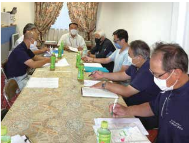
長野組合 26日 理事会の様子