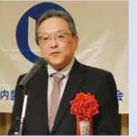
国土交通省 不動産・建設経済局局長 長橋和久氏