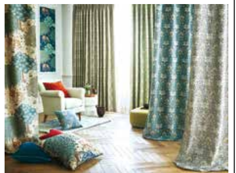
「MORRIS DESIGN STUDIO」新作

社の織技術を最大限に 活かし糸からこだわっ て開発された。 特にその思いを色濃 く反映させたのがジャ パンモダンインテリア を華やかに彩る「han oka (ハノカ)」シリ ーズ。新作では海の水面 の揺らめきとキラキラ 輝く光景をジオメトリ ックにデザインした「マ レジオメ」、孔雀が羽を 広げた姿をイメージし た優雅な流線デザイン 「ヒュマリネ」などをラ