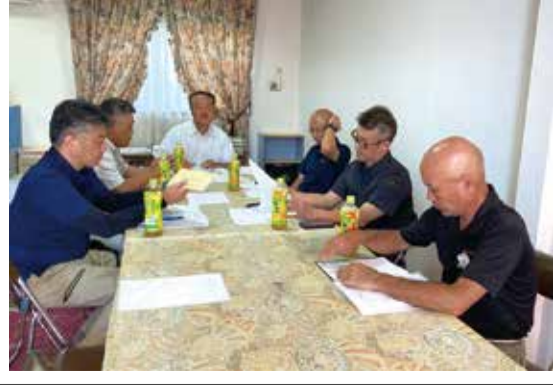
上・富山組合問屋さんとの懇談会