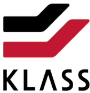
新コーポレートロゴ

もの。2本の線はステークホルダーとそれを支えるKLASSがともに歩み、そして成長していく姿を表現している。またコーポレートカラーでは、「KLASS RED」と「KLASS BLACK」の2色を制定した。KLASS REDは、新理念体系MISSIONで掲げている3つの使命から想起する「情熱・挑戦・革新」を表現、「KLASS BLACK」は、すべての色を混ぜ合わせた