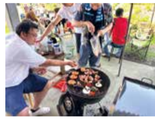
今年のパークビュー