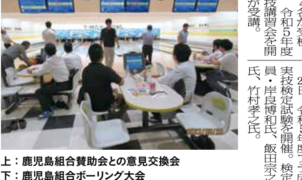
上：鹿児島組合賛助会との意見交換会 下：鹿児島組合ボーリング大会