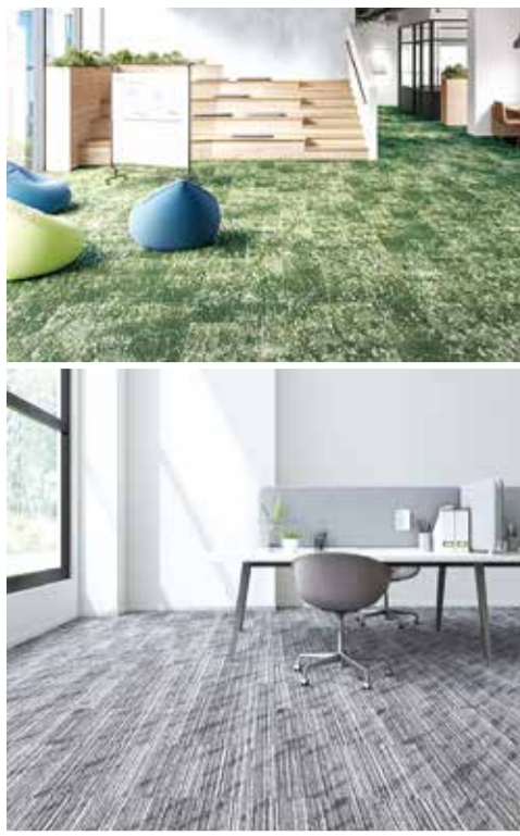
バイオフィリックデザインやトレンドを反映