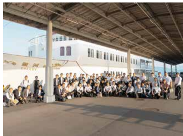
客船「銀河」でのディナークルーズ

中国ブロック青年部意見交換会は、中国地方5県持ち回りで行われていたが、今年には広島組合青年部設立20周年記念行事を併せて開催する運びとなり、前倒しでの実施となった。