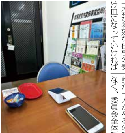
キャッシュレス決済を導入