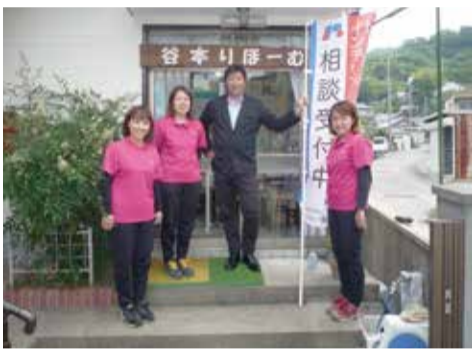
毎年5月8日は日里協インテリアリフォームデー