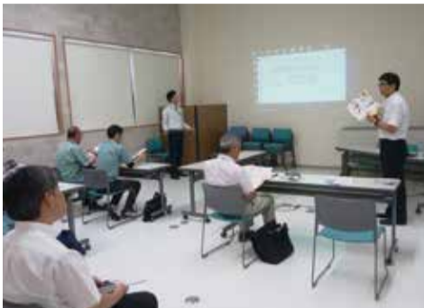
小規模な研修会を実施

この他、ホームページの公開と更新(月1回以上)、地域イベントの定期的な実施(毎年5月28日に開催するリフォーム相談会)なども必須で、これら条件を着々とクリアして