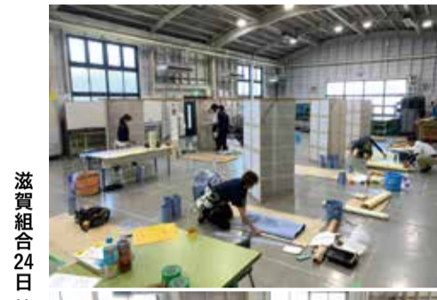
滋賀組合 24日 技能講習会壁装