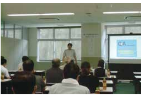
富山組合 7日 電子帳簿保存法改正セミナー