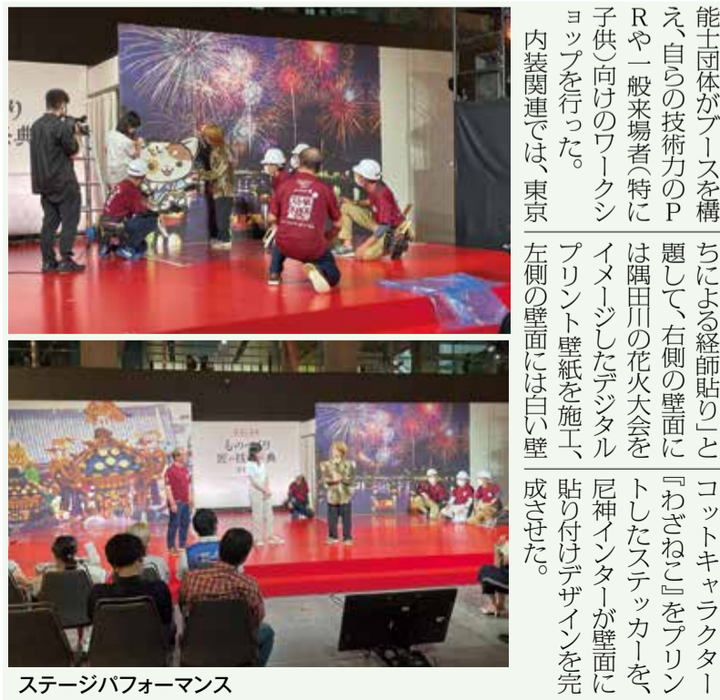
ステージパフォーマンス

「早い段階から提案に関わっていくことで、施工以外のいろいろな力が会社には必要になります。そしてそこに雇用が生まれ、育成が必要になります。これを繰り返すことで業界全体の質が上がり、内装業界が必要とされる領域が広がります。」 「早い段階から提案に関わっていくことで、施工以外のいろいろな力が会社には必要になります。そしてそこに雇用が生まれ、育成が必要になります。これを繰り返すことで業界全体の質が上がり、内装業界が必要とされる領域が広がります。」