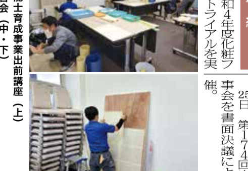
熊本組合 7日 熊本の技能士育成事業前講座(上)