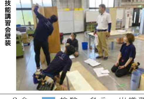
滋賀組合 24日 技能講習会壁装