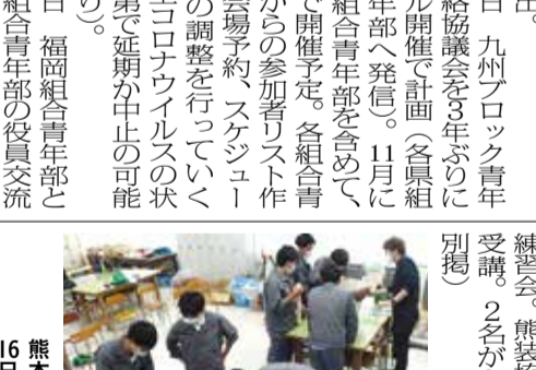
熊本組合 7日 熊本の技能士育成事業前講座(上)