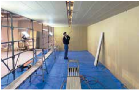
前日につくりあげた作業スペース

同講習会は、今壁紙職人の間で話題の「フラットボックス」の施工体験をメインとした講習会である。