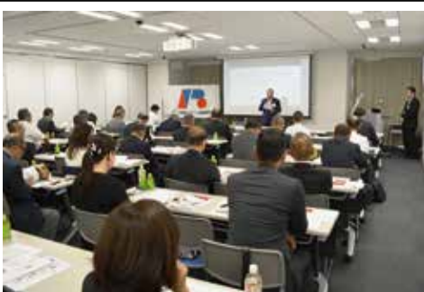
令和1年7月に開催した第1回通常総会(大阪)の様子

それとともに、日里協に対するバックアップとして組合員の加入を勧めていく義務があると今回の取材を通じて痛感しました。全国組合の皆さん、ともに協力し日里協を盛り立てていきましょう。