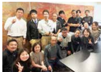
インテリアホソイ スタッフ