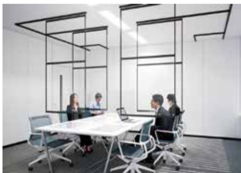
「ユニガードムーヴ」施工イメージ