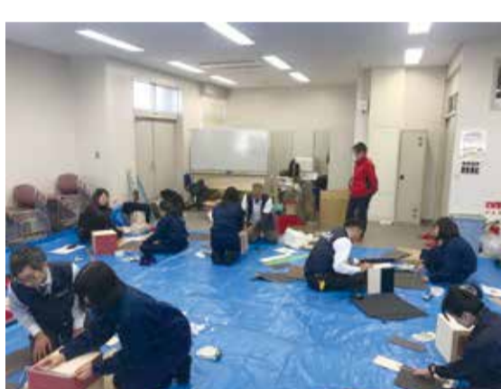
歌山工業高校への出前授業

その一方で、ボランティア活動も積極的に実施している。その一つが青年部の設立以来続けてい