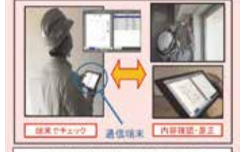
通信端末で内装仕上げの確認・是正