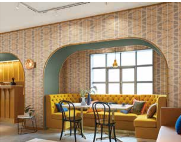
ストーリー性ある壁提案

商品面では、話題の「S」に、「言葉」を添えているのが特徴で、随所に開発の意図や注目ポイントなどを記載している。見本帳に掲載しきれなかったコピー文はWEBサイトに掲載している。