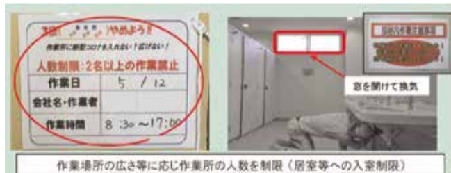
作業場所の広さ等に応じ作業所の人数を制限(居室等への入室制限)