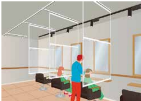
美容室での設置例

ニチペイは、飛沫感染防止対策に活用できる吊り下げ移動式パネル「ユニガードムーヴ」を新発売した。