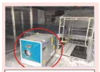
集塵機を設置し室内の換気を実施