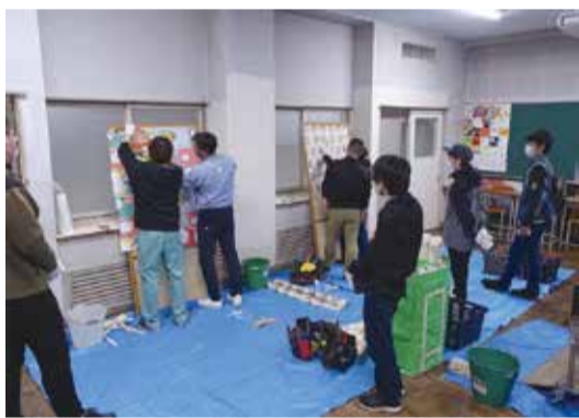
滋賀組合16日 瀬田工業高校体験学習会