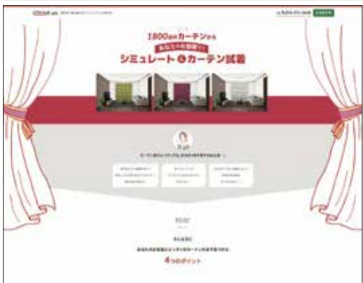
年間1200件ものカーテン掛け替えリフォームを行う株式会社コイケさんは、シミュレーターで生活者満足を高めている。

一つは、「カーテンの掛け替えは立派なリフォーム」と胸を張ってインテリアリフォームの看板を掲げている株式会社コイケ(静岡県)さんのように、リフォームは手段