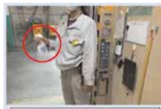
EVの操作盤等の消毒を徹底