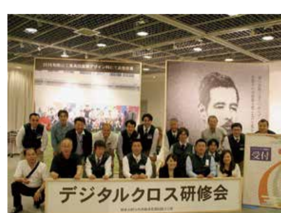
時代を先取りした取り組みを実施

青年部は経営的視点による活動が中心となっており、大きな特徴だ。今回行われた勉強会のテーマは、まさにその視点で企画された「CAD講習会」であった。 通常の内装業の仕事の流れでは、元請け業者から紙ベースの図面をもらい、そこから必要な材料の平米数を手作業で拾い出し見積りを行うが、C