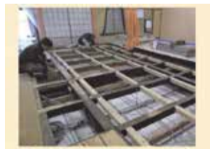
工程を分けて少人数で作業